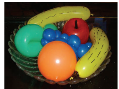
MANGER 5 FRUITS ET LEGUMES PAR JOUR

On doit en effet avoir toujours la pêche pour soigner les gens qui tombent dans les pommes et pour nous aider on nous donne des prunes ! : pas étonnant que l'on finisse la journée avec les jambes en compote.